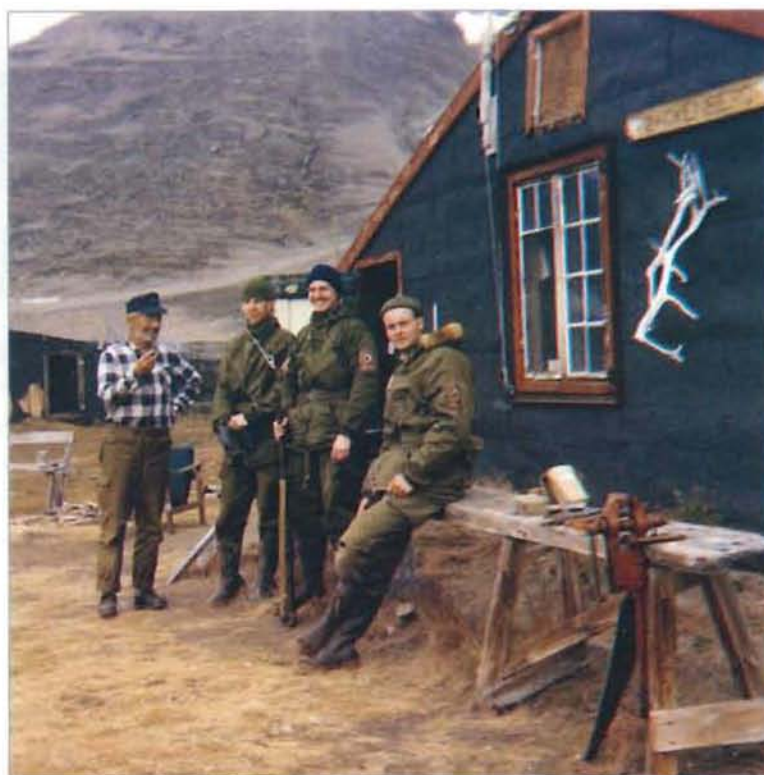
Venskabsbesøg fra Daneborg