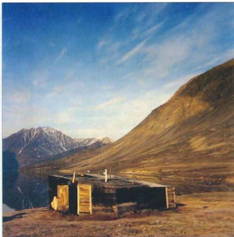
Skindhuset har fået nye døre og skodder

Vi fik skam også selv besøg. En herlig solskinsdag ankrede en Sirius-båd op ved stationen, og vi havde glæden ved at kunne beværte tre Sirius-folk med det bedste, huset formåede. Det var nu ikke alverden, og for at det ikke skulle se alt for fattigt ud, stjal jeg fra spisekamme-