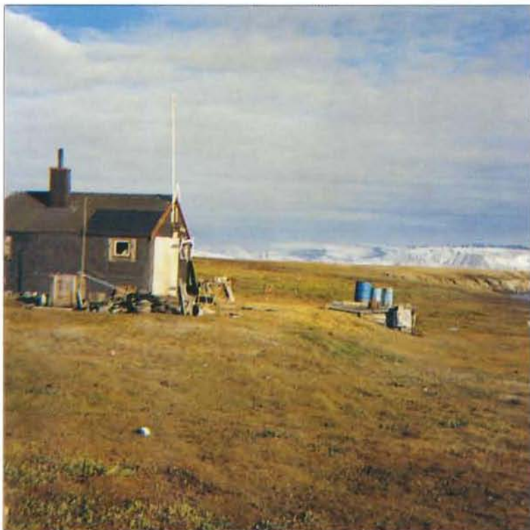
Zackenberg 1991 under restaurering